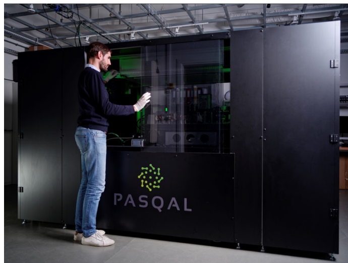
Calculateur quantique Fresnel de Pasqal acquis par GENCI

HQI (France Hybrid Quantum Initiative) est une initiative intégrée. Elle associe une plateforme de calcul hybride couplant plusieurs technologies quantiques au supercalculateur Joliot Curie de GENCI au TGCC (Très Grand Centre de Calcul du CEA), un programme de recherche - académique et industrielle - et de dissémination des usages. Cette hybridation quantique/HPC est une initiative innovante et unique, qui bénéficiera de l'expertise reconnue des équipes du CEA dans la conception et l'exploitation des infrastructures, la sécurité et le support aux scientifiques. Cette initiative permet aux chercheurs académiques et industriels, français et européens, d'évaluer gratuitement, sur une infrastructure publique, le potentiel du calcul quantique pour leurs applications. Elle vise également à développer des collaborations internationales pour favoriser la recherche ouverte.